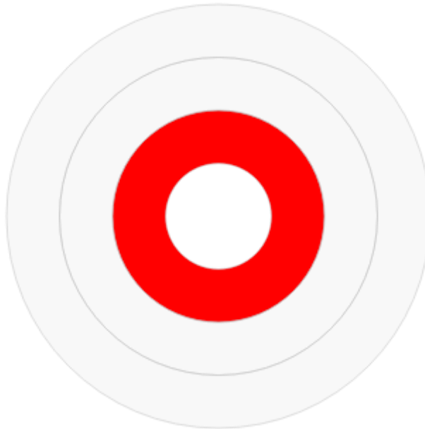
Beleid op het vlak van leer- en leefomgeving, veiligheid en hygiëne

Het bestuur van de NAFT-aanbieder is verantwoordelijk voor de leer- en leefomgeving, veiligheid en hygiëne van de gebouwen en lokalen. De zorg- en onderwijsinspectie gaat enkel na of de NAFT-aanbieder hiervoor een doeltreffend beleid ontwikkelt en voert.